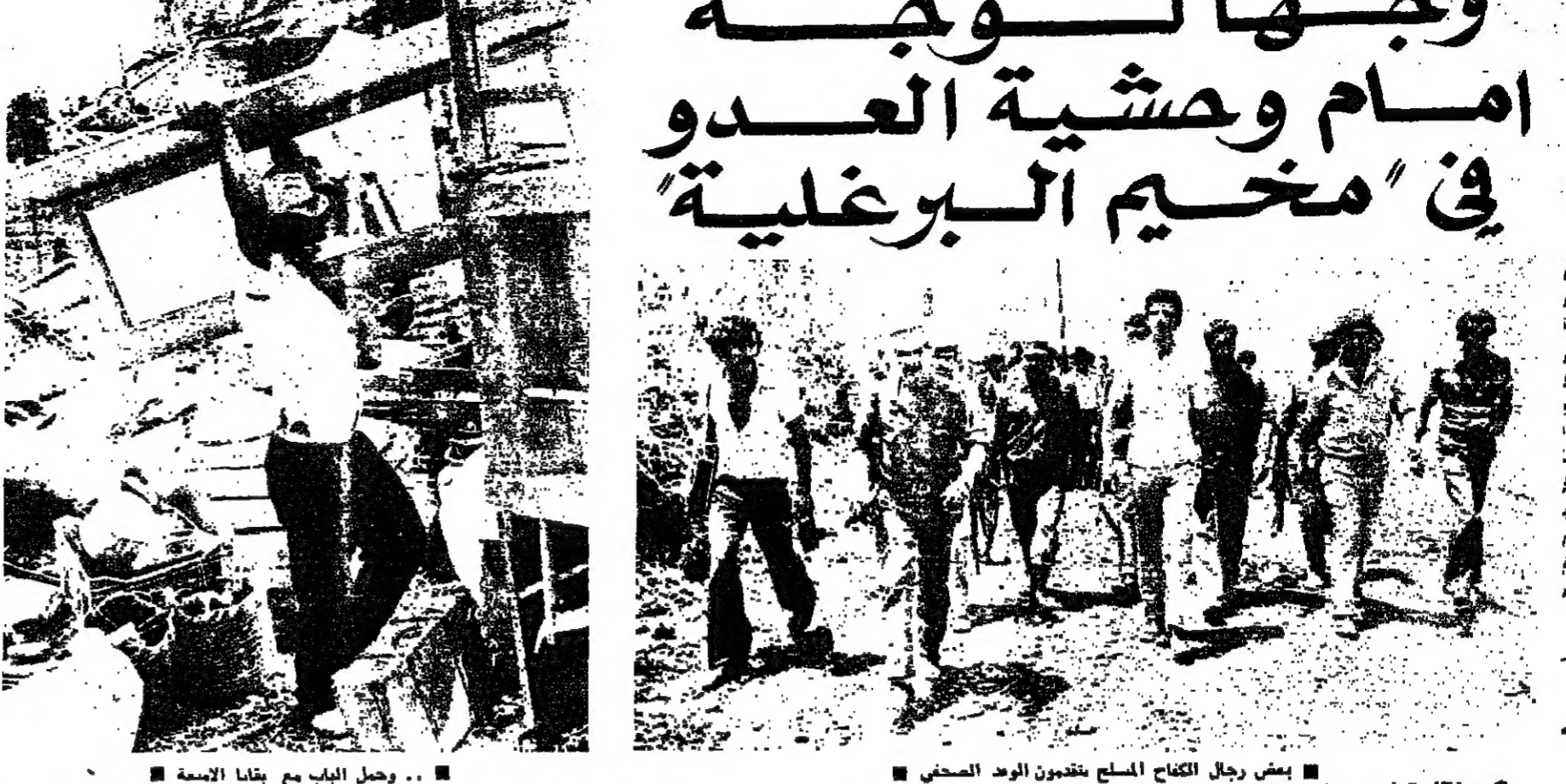
بعض رجال الكفاح المسلح يتفحصون الوعد الصحي ... وحمل الباب مع بقايا الامعة